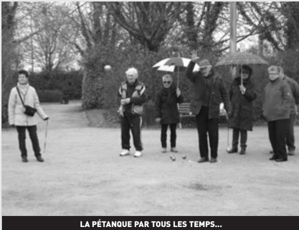
LA PÉTANQUE PAR TOUS LES TEMPS...

Les années passent et notre section reste toujours présente et fidèle à notre "Parlons En".