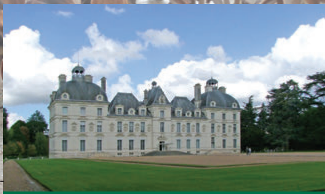
LE CHÂTEAU DE CHEVERNY