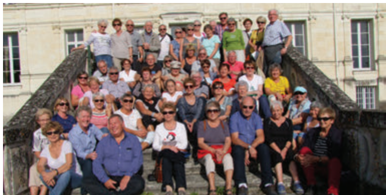
LE GROUPE AU COMPLET

Au matin du deuxième jour nous avons pris la direction de du charmant village de Mennetou sur Cher chargé d'histoire. Ses premières fortifications, construites pour parer aux attaques anglaises, datent de 1212 et elles ont été poursuivies tout au long du XIIIème siècle avec la construction de trois portes (dont l'une aurait été empruntée par Jeanne D'Arc). C'est Bertrand Duguesclin qui libérera définitivement Mennetou du joug des Anglais en 1370. Après cette visite culturelle, appréciée de tous, nous changeons totalement