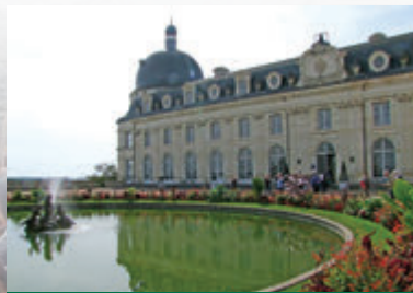
LE CHÂTEAU DE VALANÇAY