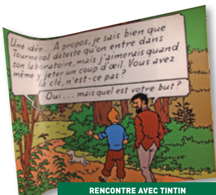
RENCONTRE AVEC TINTIN